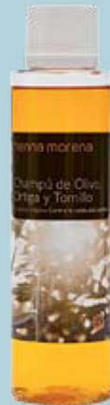
Champú de olivo, ortiga y tomillo, para la caída.