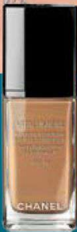
1. Vitalumiere de Chanel.

PASO 2 Maquillaremos la ceja con un tono clarito, empezando de la nariz hacia el exterior. Nos puede servir el mismo producto que hemos utilizado para el maquillaje de noche en el caso de Delevingne.