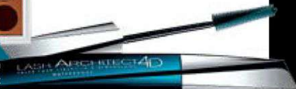
4. Máscara Lash Architect 4D de L'Oréal.

PASO 5 Crearemos, utilizando colorete, un rubor sobre el pómulos en forma de cruz con un producto que nos dé frescura.