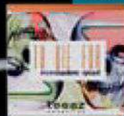
3. Sombra de ojos Cinnamon de Teeez.

PASO 3 Aplicamos con el dedo sobre el párpado móvil una sombra en crema con un tono visón. También podemos utilizar sombras en polvo con colores neutros.