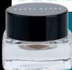
3. Sombra en crema de Bobbi Brown.

PASO 3 Aplicamos con el dedo sobre el párpado móvil una sombra en crema con un tono visón. También podemos utilizar sombras en polvo con colores neutros.