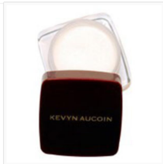
Mousse Glassé de Kevin Aucoin

Sombras mates en color Bison de Bobby Brown o Cristian Dior.